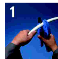
1 Cortar el tubo

Una de las ventajas de este sistema es su facilidad de montaje. El proceso se reduce a cuatro fases: