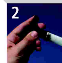
2 Calibrado-biselado del tubo