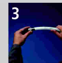
3 Ensamblar accesorio